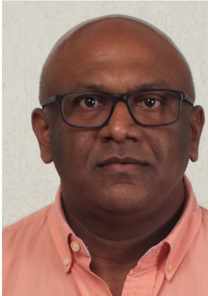
Adit Moensi Econoom

In 2050 is Suriname de 'Country of choice' voor "Foreign Direct Investment". De economie is genoeg gediversifieerd zodat potentiële prijsschommelingen op de wereldmarkt makkelijk opgevangen kunnen worden.