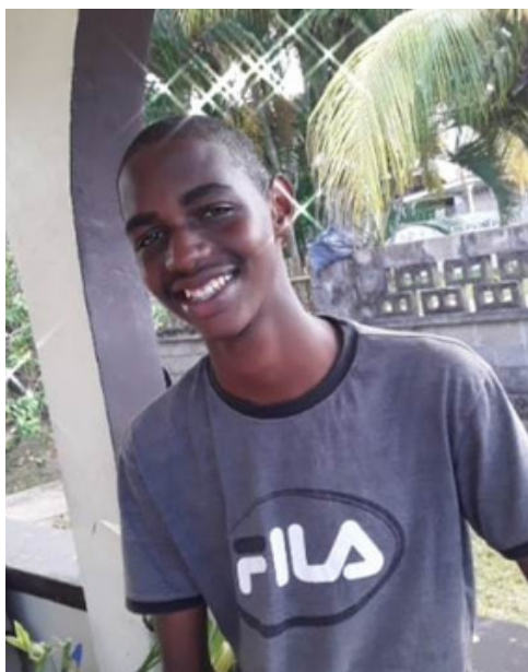
Shemar Rier Scholier Ewald Meyer Lyceum

In 2050 is mijn land het centraal punt in het Caraïbisch gebied, een land dat een toevlucht wordt voor velen. Suriname is dan een land dat financieel, economisch, sociaal en maatschappelijk sterk staat om het ware voorbeeld te zijn waartoe Suriname geroepen is: een land van multiculturele diversiteit, een land dat zich niet schaamt om zich te uiten door middel van haar tradities, voedsel, klederdrachten, de verschillende talen en haar verscheidenheid van cultuur.